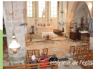
Intérieur de l'église