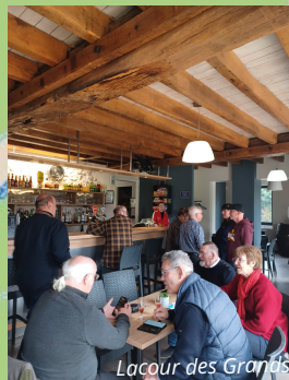
Lacour des Grands