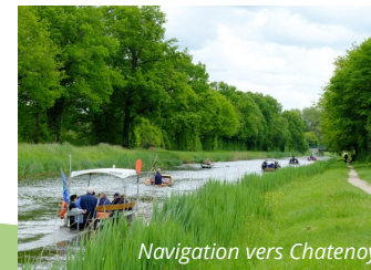
Navigation vers Chatenoy