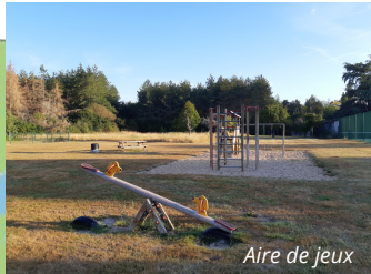
Aire de jeux

La commune immergée en pleine nature constitue un point de départ idéal pour des balades à pied, à cheval, en vélo le long du canal ou vers la forêt. Laissez-vous séduire par le charme de ce village et, à votre départ ou à l'arrivée, n'oubliez pas de faire une halte à "Lacour des Grands".