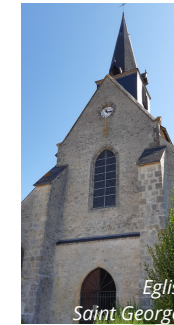
Eglise Saint Georges

Ses constructeurs furent d'abord les seigneurs de Blaire au 15 e siècle. Ne subsiste de cette construction Renaissance que la porte dite «Porte des seigneurs», l'édifice ayant été remanié plusieurs fois au cours des siècles.