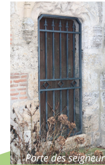
Porte des seigneurs